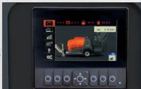
Neues überarbeitetes Bedienkonzept: Der Bediener kann alle notwendigen Informationen direkt von der Bedienstelle aus einsehen und einstellen.