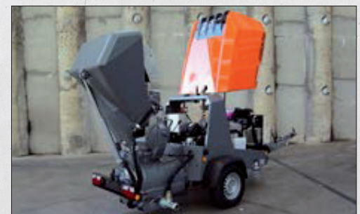
Das neuartige Haubenkonzept und das abnehmbare Rückteil ermöglichen eine hohe Zugänglichkeit zu allen wichtigen Service und Wartungspunkten